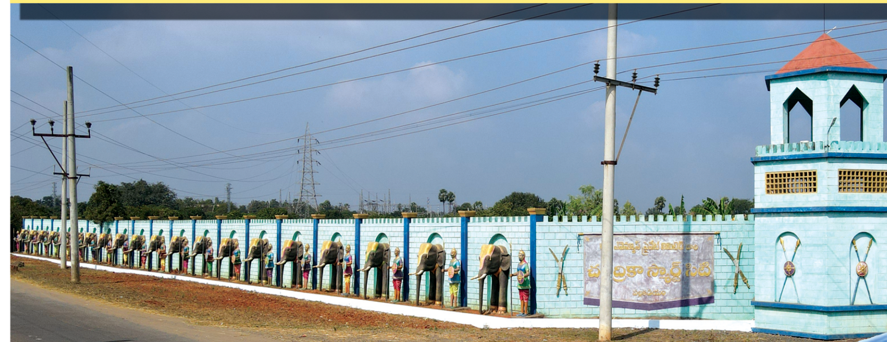
సైటు వాస్తవ చిత్రం

చుగ్గా 1కి ₹ 3,900/- మాత్రమే ఏ అదనపు చార్జీలు లేవు